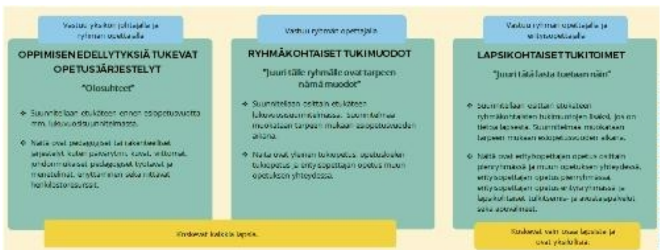
Kuvio 6. Oppimisen ja esiopetukseen osallistumisen tuen toteuttaminen Tampereella.

Kuviossa 6 esitetään oppimisen ja esiopetukseen osallistumisen tuen toteuttamisen käytänteitä Tampereella.