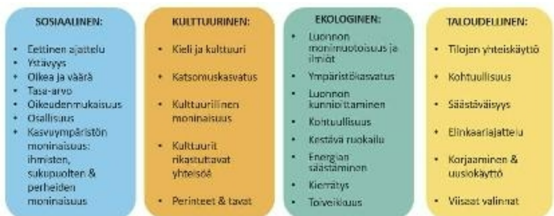
Kuvio 3: Kestävä elämäntapa varhaiskasvatuksessa ja esiopetuksessa.

Esiopetuksessa toteutettavan arjen kestäväystyön tueksi on laadittu Kestävä elämäntapa Tampereen varhaiskasvatuksessa ja esiopetuksessa -opas. Opas avaa kestävästä tulevaisuudesta työn tarkoitusta ja taustaa sekä tuo esille Tampereella käytössä olevia toimintatapoja ja yhteistyötahoja.