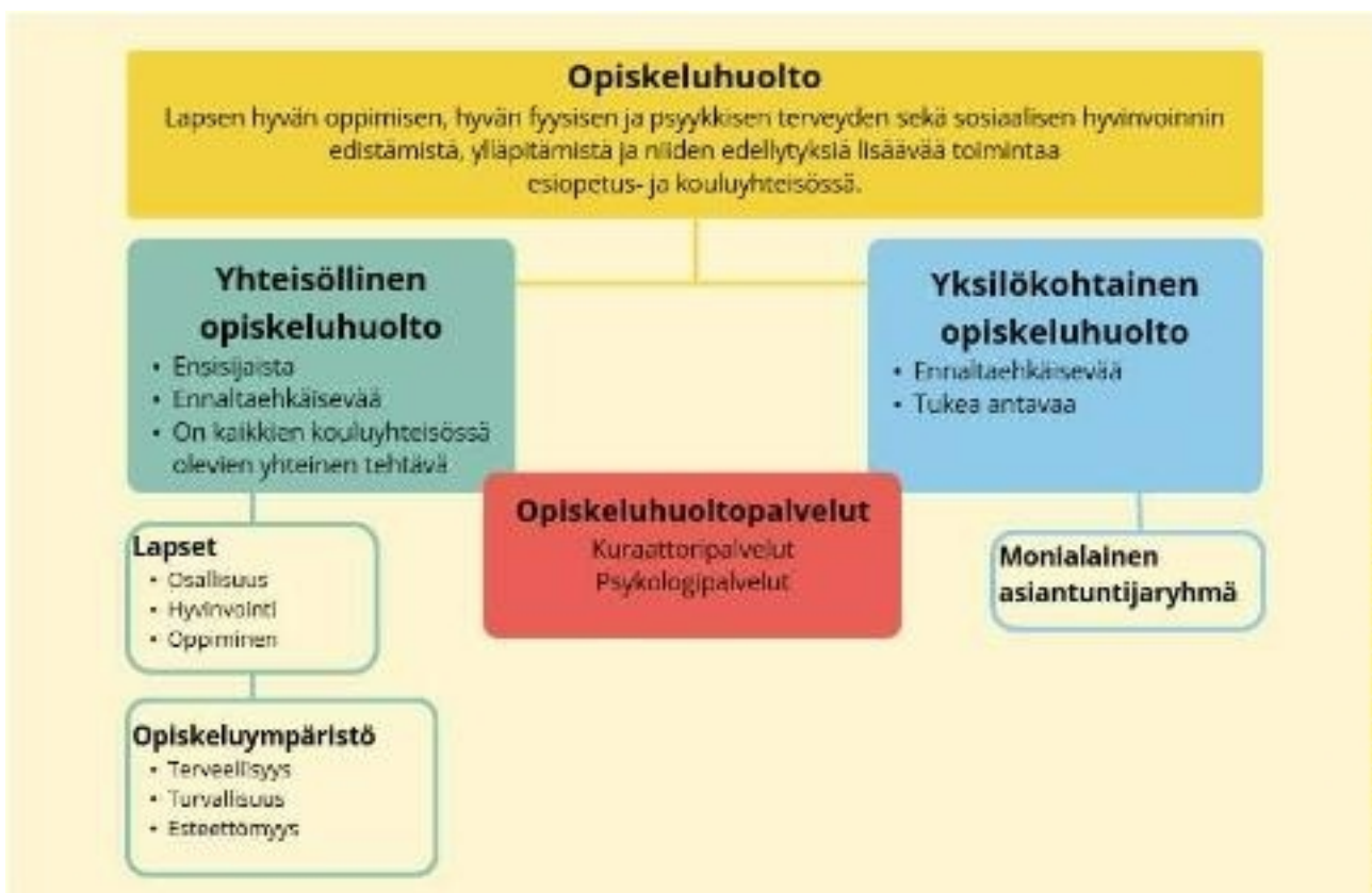
Kuvio 7. Opiskeluhoillon kokonaisuus Tampereen kaupungin esiopetuksessa.

Tampereen kaupungin opiskeluhoitosuunnitelma korvaa opiskeluhoillon osalta paikallisen opetussuunnitelman.