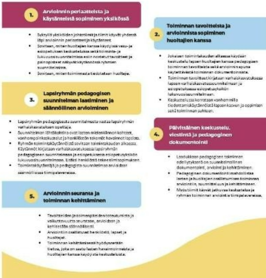
Kuvio 4. Arviointikulttuurin kulmakivet Tampereen kaupungin varhaiskasvatuksessa ja esiopetuksessa.