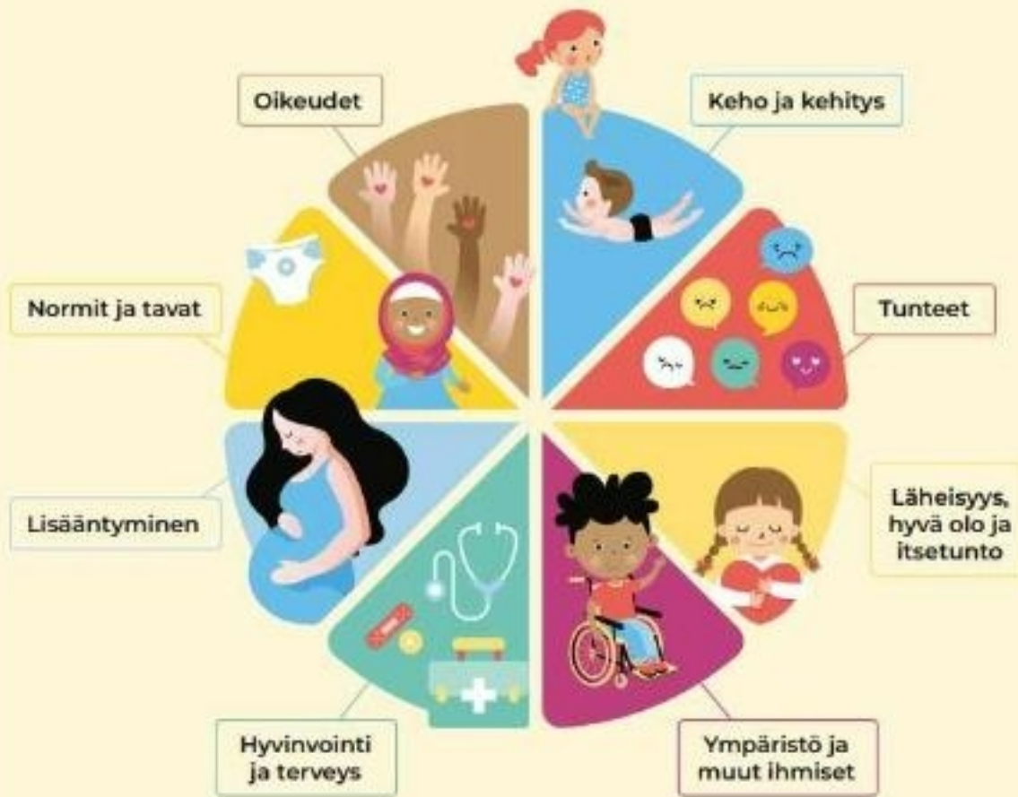
Kuvio 2. Kehotunnekasvatuksen osa-alueet

Lähde: Terveyden ja hyvinvoinnin laitos (THL), Maailman terveysjärjestön (WHO) ja Euroopan alueoimista ja BZgA (2010) Seksuaalikasvatuksen standardit Euroopassa: Suuntaviivat poliittisille päättäjille, opetus- ja terveydenhoitoalan viranomaisille ja asiantuntijoille.